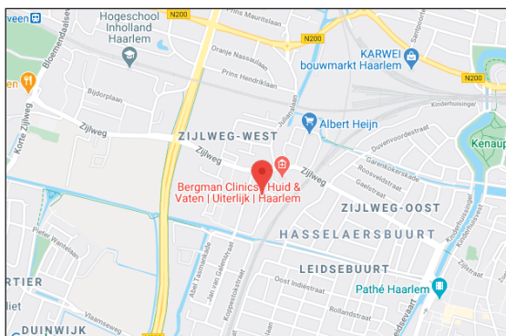
noorden kadastrale kaart