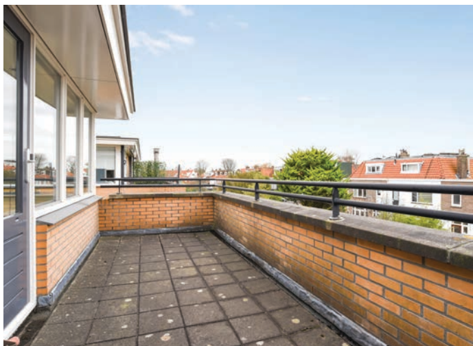
Toegang tot het dakterras