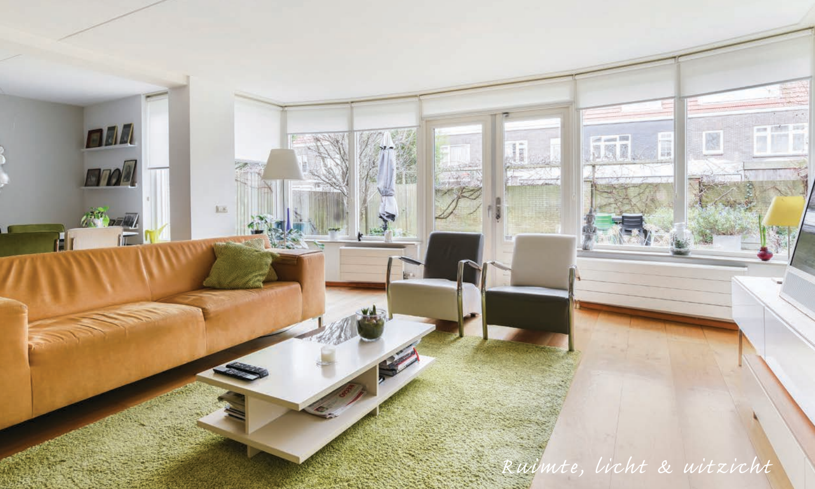
Ruimte, licht & uitzicht